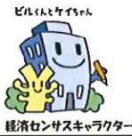
経済センサスキャラクター