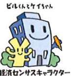
経済センサスキャラクター